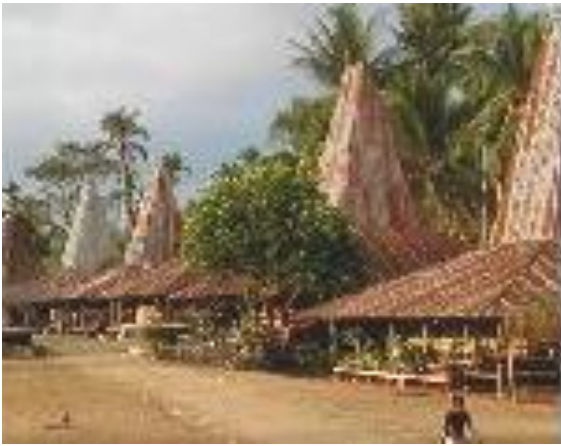
Gambar 3. Beberapa rumah adat menggunakan seng sebagai bahan penutup atap pengganti alang-alang.

Di masa lalu, alang-alang, akar pohon, pohon, dan bambu dapat dengan mudah ditemukan di semua wilayah Pulau Sumba. Saat ini, pasokan bahan-bahan tersebut jauh dari mencukupi. Hal ini disebabkan adanya peningkatan kebutuhan akibat pembangunan, perbaikan rumah adat yang rusak, berkurangnya jumlah pohon dan bambu di hutan, serta serangan rumput liar yang mematikan bibit alang-alang.