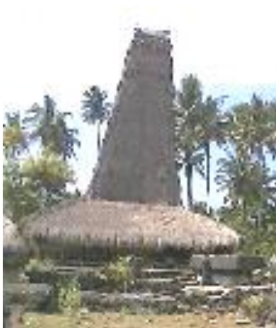
Gambar 1. Tiga bagian utama rumah adat Sumba terdiri dari atap, induk rumah dan kolong.

Bangunan rumah adat Sumba terdiri dari 3 bagian utama yaitu atap/uma deta, induk rumah/bei uma, dan kolong/ kali kambunga [5]. Ketinggian atap yang hampir tiga kali tinggi badan bangunan menjadikan atap sebagai bagian yang mendominasi. Hal ini pula yang menyebabkan atap tersebut diistilahkan dengan sebutan atap menara. Konstruksi atap berupa atap panggung yaitu atap dengan bahan kayu sebagai struktur utama dan bambu sebagai kasau[3]. Penutup atap terbuat dari rangkaian ikatan alang-alang yang ditumpuk mulai dari bagian bawah sampai ke atas atap. Bagian induk rumah terdiri dari kolom dan dinding. Konstruksi bangunan menggunakan sistem rangka dengan 4 kolom utama sebagai penopang beban bangunan.