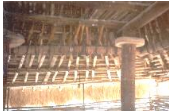
Gambar 2. Konstruksi atap panggung (kayu sebagai struktur utama dan bambu sebagai kasau), sistem rangka, serta simpai pada rumah adat Sumba.

Di Tahun 2002, ditemukan beberapa rumah adat yang mulai roboh karena tiang yang termakan rayap atau rusaknya atap alang-alang. Bahkan beberapa kampung adat di Sumba Barat maupun Sumba Timur telah hilang tanpa bekas. Di tempat lain, beberapa bangunan rumah adat yang telah dan sedang direnovasi telah menggunakan material serta konstruksi yang berbeda dengan mempertahankan bentuk fisik bangunan. Beberapa rumah adat mulai menggunakan seng sebagai bahan penutup atap, paku sebagai pengganti ikatan tali yang terbuat dari akar pohon serta penyekatan ruang di dalam rumah adat[6]. Kondisi ini disebabkan karena tingginya kebutuhan akan material alam sementara ketersediaan berkurang, serta keterbatasan dana pemilik rumah adat.