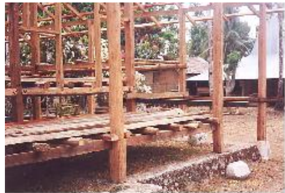
Gambar 4. Renovasi rumah adat dengan pondasi umpak berbahan beton bertulang, balok kayu sebagai rangka atap, kolom penunjang, dan sambungan dengan paku.

terutama untuk menjembatani kekurangan yang diakibatkan oleh ketersediaan material alam selain untuk penghematan bahan baku, kepraktisan, kemudahan dan kecepatan pelaksanaan. Beragam material selain ijuk dapat digunakan seperti seng, paku, balok kayu, papan, semen, dan beton bertulang. Konstruksi ikatan dengan balok gapit dan paku serta bukaan berupa jendela sebagai jawaban atas keterbatasan bahan dan perlunya cahaya serta udara di dalam rumah. Peralihan pelaksana pembangunan dengan melibatkan tukang bangunan kadang diperlukan tanpa meninggalkan ritual budaya.