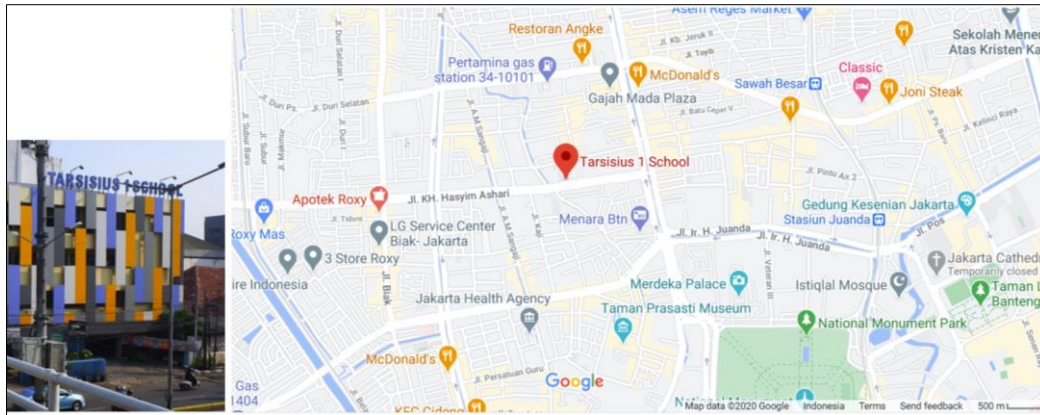
Gambar 1. Peta lokasi tempat pelaksanaan kegiatan di sekolah Tarsisius I Jakarta

Masyarakat yang merupakan target kegiatan adalah orang tua, guru, caregiver murid SD dan SMP Sekolah Tarsisius 1, Jakarta Pusat. Total sebanyak 84 orang peserta yang hadir mengikuti kegiatan acara penyuluhan dan pelatihan ini. Penentuan peserta dan topik kegiatan berdasarkan hasil literatur review yang disesuaikan dengan kondisi saat ini untuk menentukan permasalahan yang dapat dialami akibat pandemi COVID-19 pada anak dan remaja.