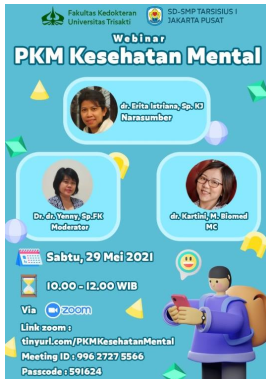
Gambar 2. E-flyer kegiatan penyuluhan dan pelatihan

Pengukuran tingkat pengetahuan dan keterampilan peserta yang menjadi target kegiatan dilakukan dengan menggunakan kuesioner yang terdiri dari 12 pertanyaan yang dianggap dapat merepresentasikan tingkat pengetahuan tentang kesehatan jiwa anak. Penentuan titik potong kategori tingkat pengetahuan dan keterampilan baik dan buruk dibuat berdasarkan nilai rerata [(\text{nilai minimal} + \text{nilai maksimal})/2] jumlah jawaban responden yang menjawab benar pasca pengisian kuesioner. Tingkat pengetahuan dan pelatihan dikategorikan baik bila menjawab benar 11 dari 12 buah pertanyaan, sedangkan kurang bila menjawab benar kurang dari 11 pertanyaan. Contoh kuesioner penyuluhan dan pelatihan kesehatan jiwa keluarga dapat dilihat pada Tabel 1.