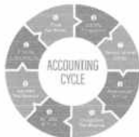
Salah satu contoh Siklus Akuntansi

Proses pengidentifikasian, pencatatan, dan pengkomunikasian kejadian-kejadian ekonomi dari suatu organisasi kepada pengguna/pihak yang berkepentingan terhadap informasi.