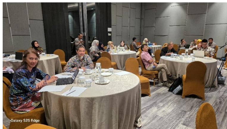
Kegiatan hari-1: FGD kelompok bidang produksi