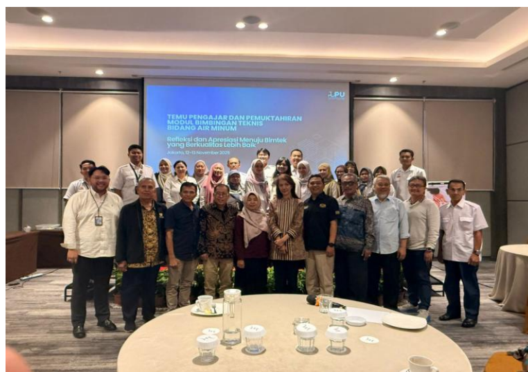
Kegiatan hari-2: Foto bersama setelah pleno penutupan