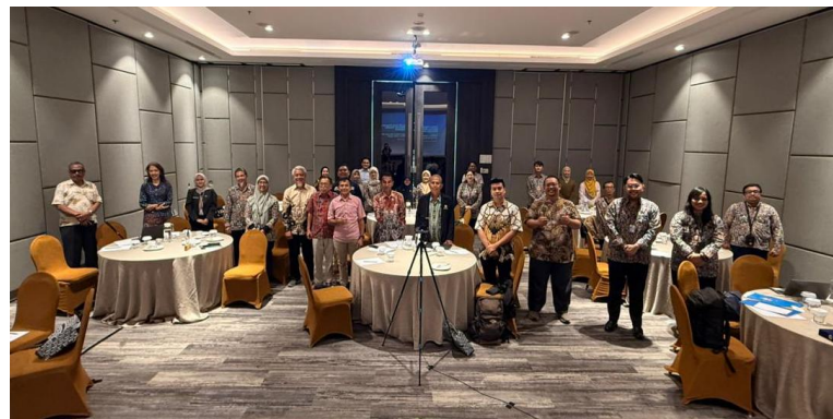
Kegiatan hari-1: Pembukaan pemutakhiran kurikulum dan modul