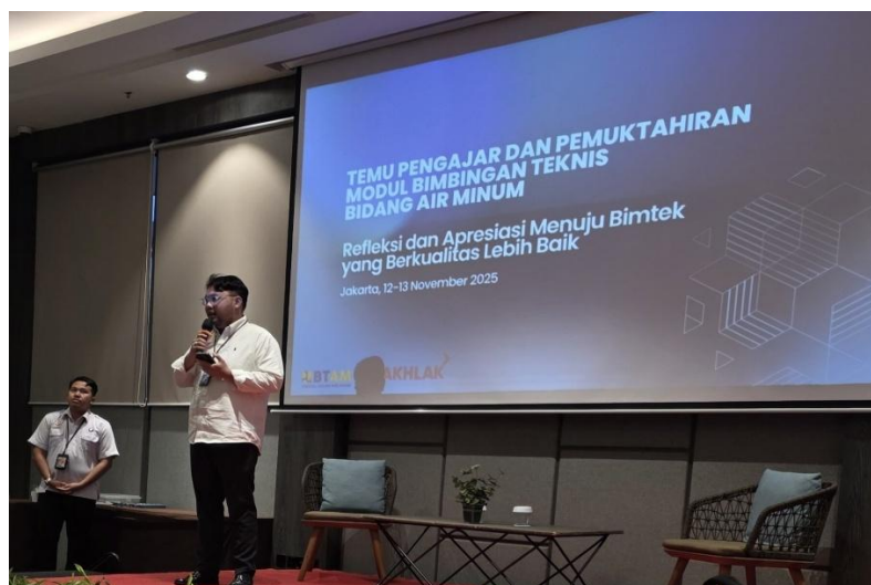
Kegiatan hari-2: Pleno penutupan