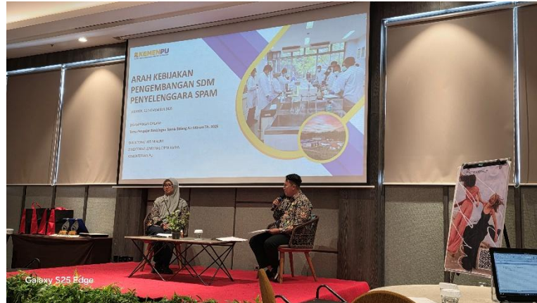
Kegiatan hari-1: temu pengajar dan arahan pengembangan SDM